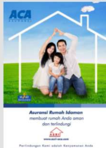
ASURANSI RUMAH IDAMAN (ASRI)